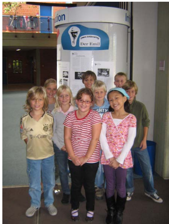
Die Reporter vor ihrer Litfaßsäule.

Innerhalb des ersten Jahres haben sich etwa 40 Leserinnen