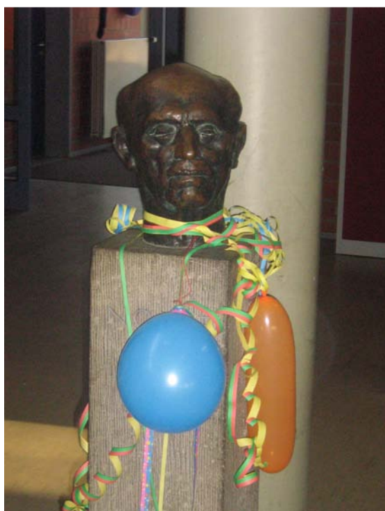
Unser Emil freut sich auf alle Besucher

Noch werden eifrig Stellwände vorbereitet, Plakate erstellt und Pläne gemacht, denn am 7.11.2009 findet wieder von 10 bis 13 Uhr der Tag der offenen Tür der Emil-Nolde Schule statt.