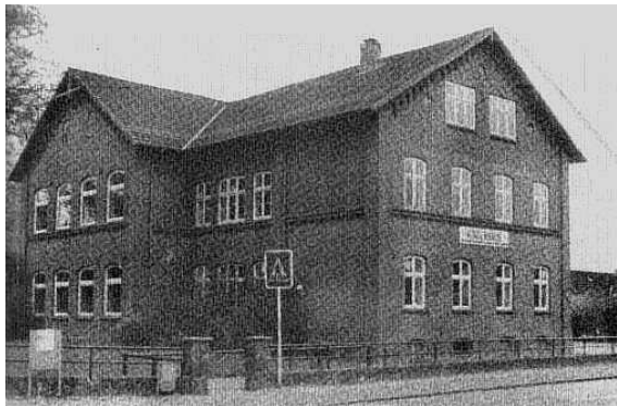
Unser allererstes Schulgebäude ist heute das Kinderhaus

Mit drei Klassen und drei Lehrerwohnungen wurde 1887 neben der ev.-luth. Kirche an der alten Landstraße das erste Schulhaus für Bargteheide errichtet.