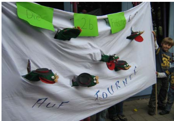
Die ENS-Muppets im Einsatz (2b)

Außerdem war eine große Tombola vom Förderverein in der Aula. Zusätzlich sollte jede Klasse draußen ein bis zwei Spiele anbieten, so gab es