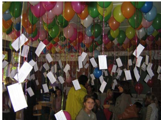
Die Luftballons vom Wettbewerb

In der Betreuten konnte man sich für 1.00 € einen Luftballon, der mit Gas gefüllt war, für einen Luftballon-Weitflugwettbewerb kaufen. Der Besitzer, dessen Luftballon am weitesten geflogen