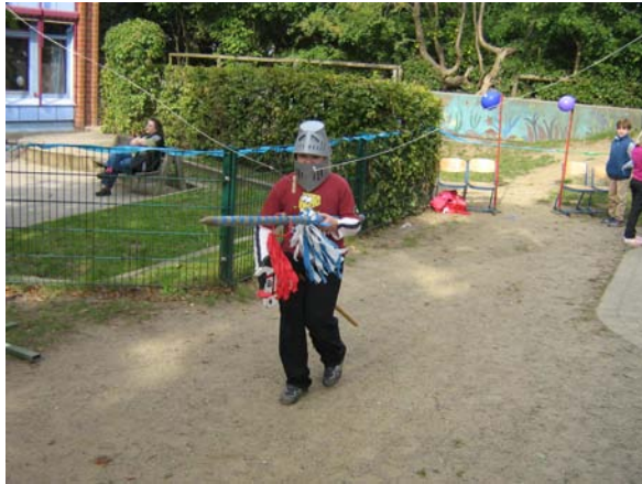
Ringe - Reiten hoch zu Ross der 3c

Am 20.9.2008 fand an unserer Emil-Nolde-Schule das große Schulfest statt. Es begann um 15.00 Uhr mit einem riesengroßen Kuchenbuffet, sowie einem Grillstand mit Würstchen und einem Getränkestand. Für Essen und Trinken war also super gesorgt.